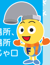
水道局マスコット フクちゃん